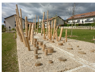
Aménagement de parcs publics