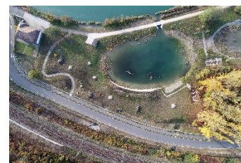
Aménagement de plans d'eau