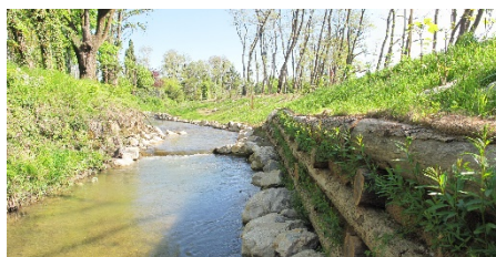
Renaturation de cours d'eau